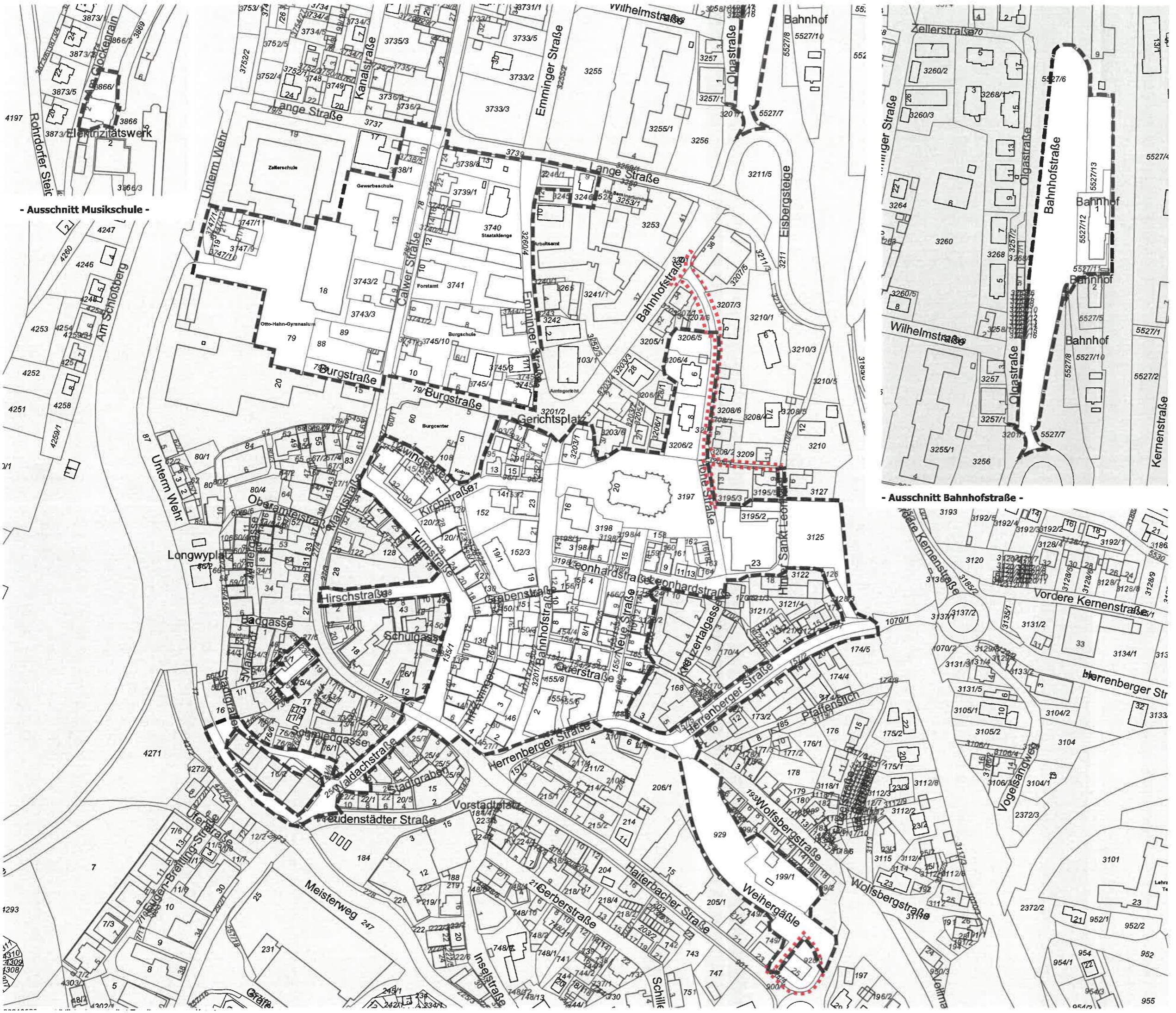
- Ausschnitt Musikschule -

0 10 20 40 60 Maßstab 1:2500 (A3) Stuttgart 23.06.2021 Bader / Konzl