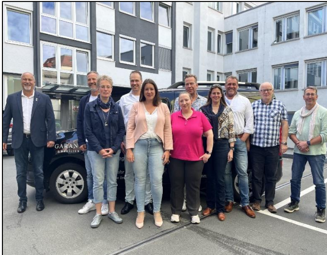
Lehrgangsteilnehmer Fachseminar ImmoWertA 2023